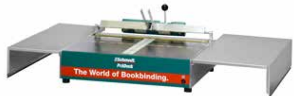
Maschine mit optionaler Tischvergrößerung